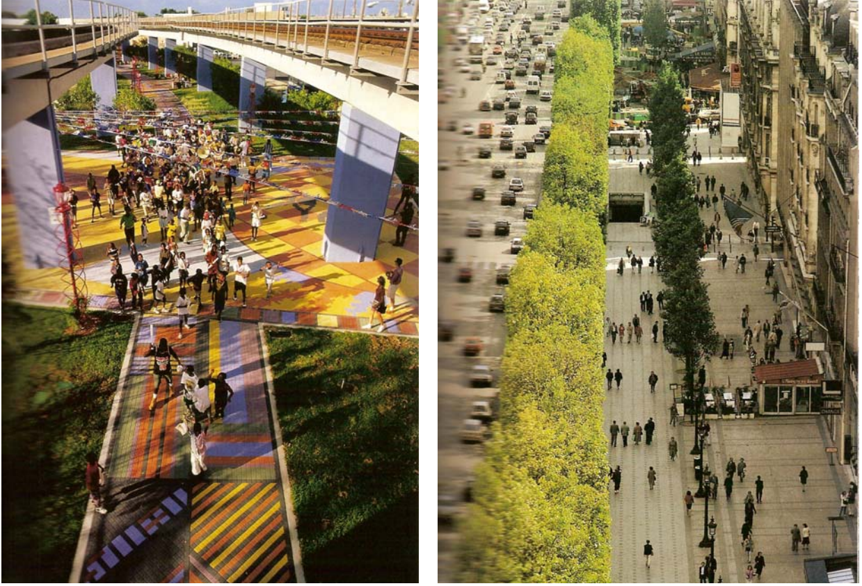
Şekil 1. Overtown Pedestrian Mall, Miami, ABD ve Champs Elysees, Paris, Fransa (Cerver, 2003).