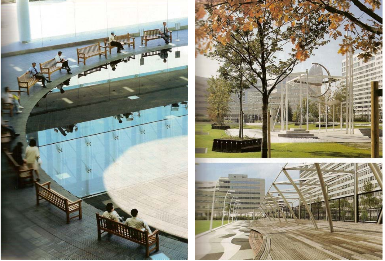
Şekil 4. Solid Square, Kanagawa, Japonya ve Le Jardin Atlantique, Paris, Fransa (Cerver, 2003).

Nesneler ve çevreler estetik bağlamda değerlendirildiklerinde görülmektedir ki her zaman algılanan form ile ima edilen form arasında farklılıklar ortaya çıkmaktadır. Çevresel ya da estetik algılamada bazı ortak algılar 'ın yanı sıra bazı özel algılar (bireysel algılar) da söz konusudur. Bir objenin ya da çevrenin " bilinir " olabilmesi için " tanımlı " yani çevreyi oluşturan diğer öğeler arasında daha belirgin ve " sınıflanabilir " yani belli bir kavramla ilişkilendirilebilir nitelikte olmalıdır (Şekil 4).