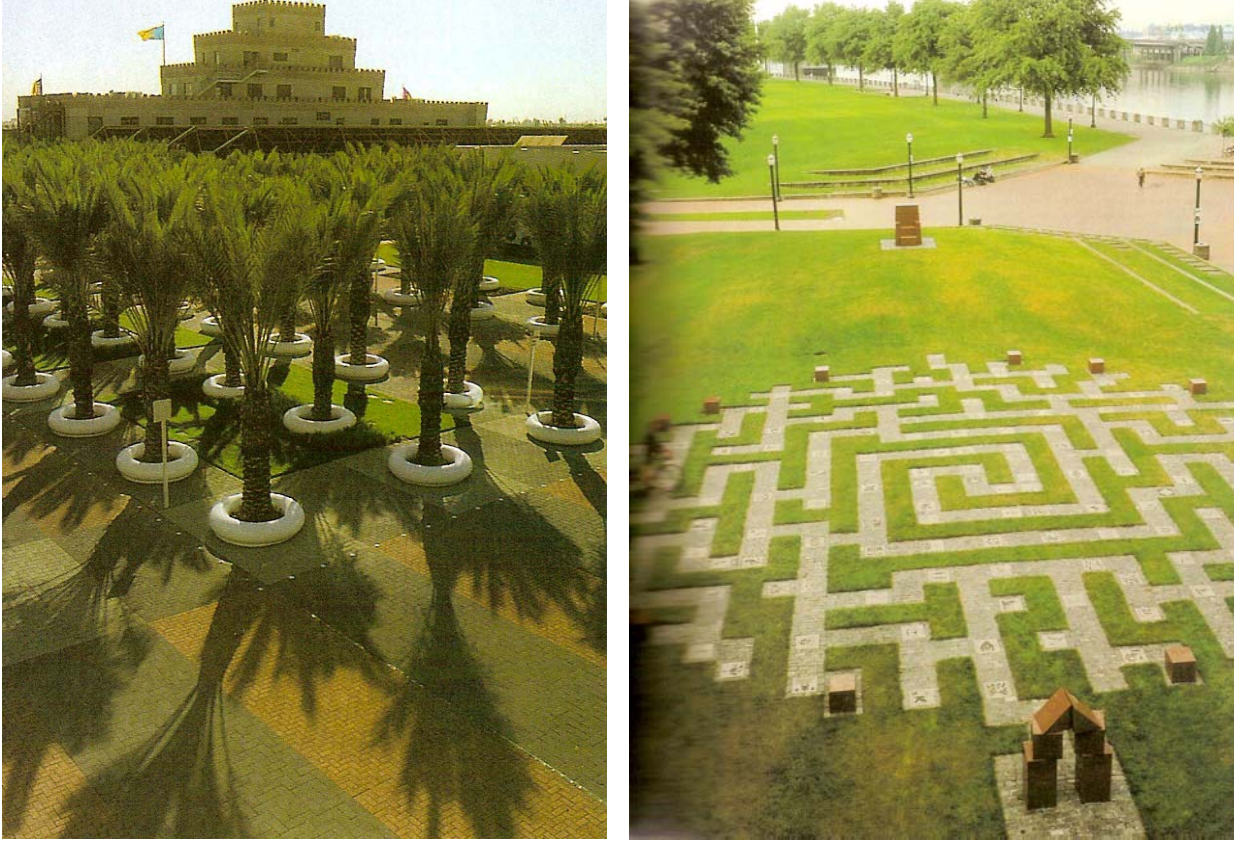
Şekil 2.The Citadel,California, ABD ve Story Garden, Oregon, ABD (Cerver, 2003).

Estetik sadece sanattaki güzeli değil, yani sadece sanat felsefesini değil, doğadaki güzeli de kapsamaktadır. Dolayısı ile hem doğal hem yapay öğelerin değerlendirilmesinde yararlanılan bir algılar öğretisi, duyubilimdir (Bozkurt, 2000). Estetik yaklaşımda orantı ve uyum en önemli olgular olup tasarımda birlik oluşturmanın en kolay yolları olarak nitelenmektedir. Birliğe sahip tasarım öğeleri ya da oluşumlar ise estetik ve güzel olarak algılanmaktadır. Çevrede, sanatta, tasarım objesinde birlik sağlanamamış, parçalar organik olarak birbirine bağlı ve uygun değil ise estetik olması da söz konusu değildir ve bunu oluşturan da öğelerin bir araya gelmesinde kurgulanan/oluşturulan düzendir.